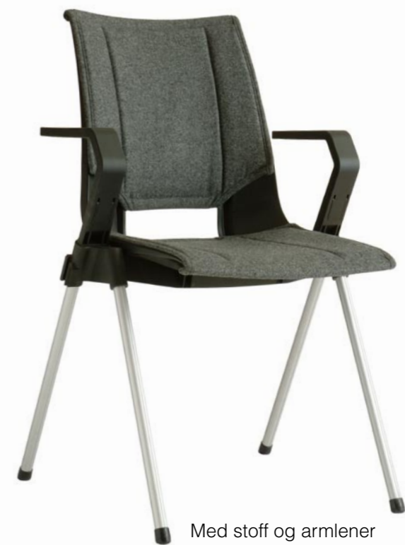
Med stoff og armlener