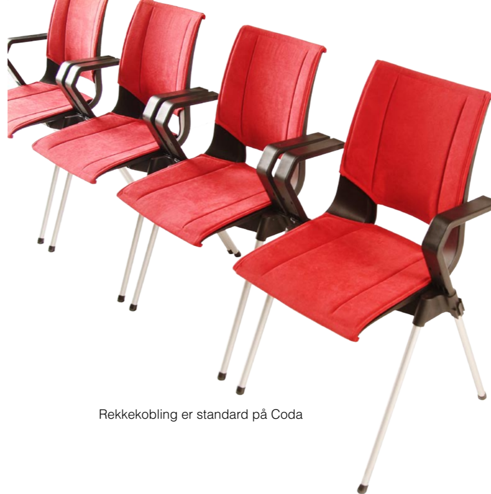
Rekkekobling er standard på Coda