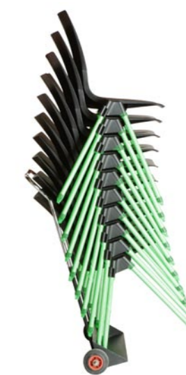
Coda i stabel på Nordic stoltralle