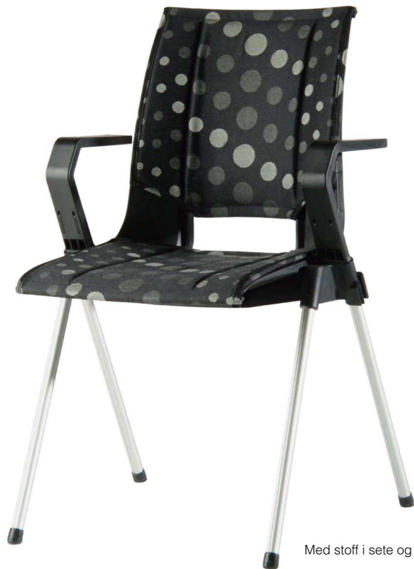
Med stoff i sete og rygg