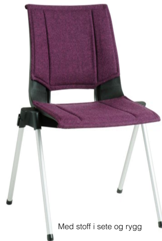
Med stoff i sete og rygg