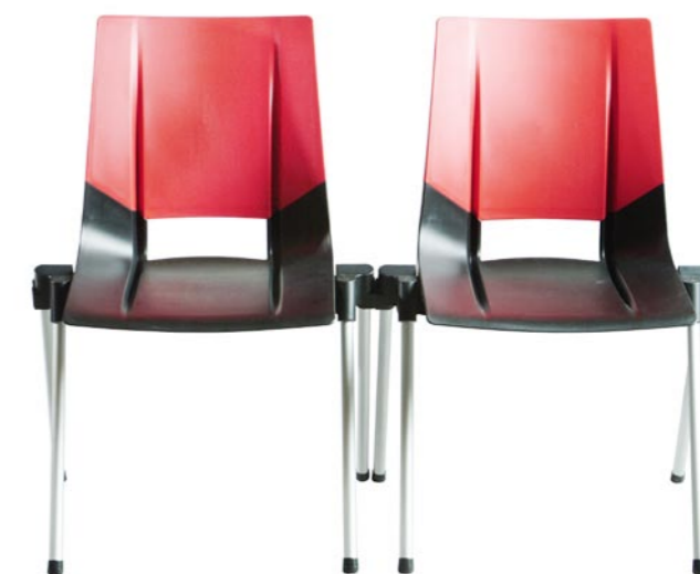
Rekkekobling er standard på Coda